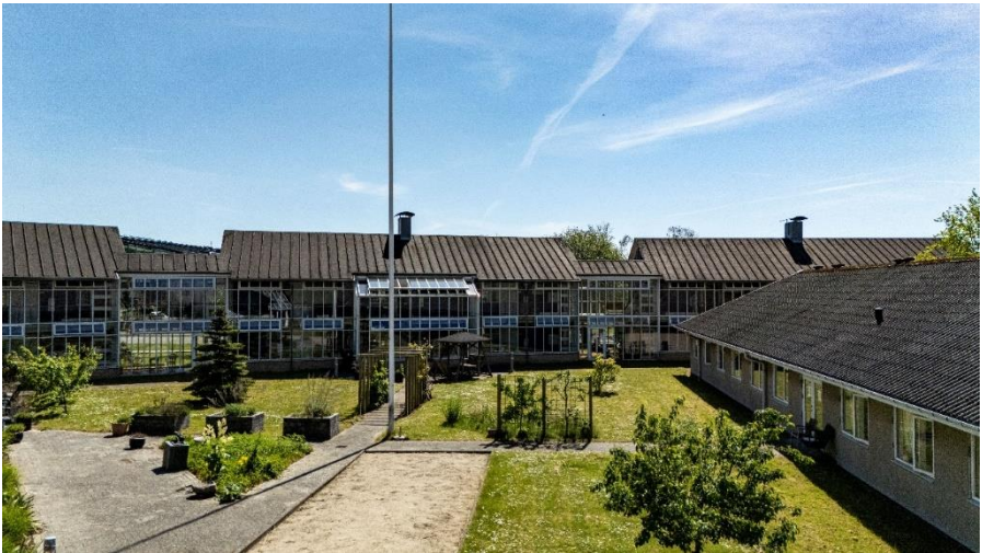
Tolleruphøj fra en af gårdhaverne

Omsorgscentrets personale kan ikke påtage sig ansvaret for beboernes penge og andre værdigenstande. Du bedes derfor selv sørge for forsvarlig opbevaring af disse.