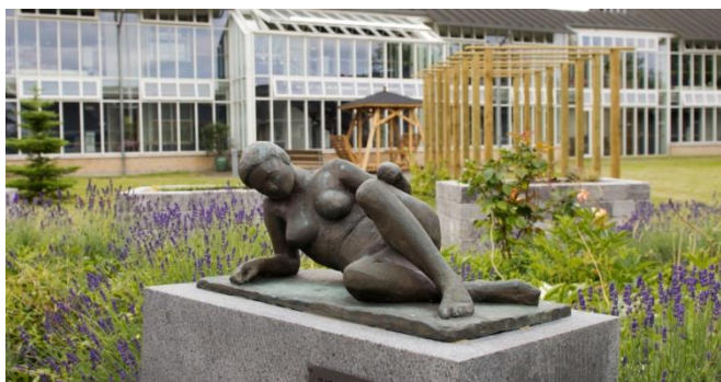
Billedet viser en af havens smukke skulpturer